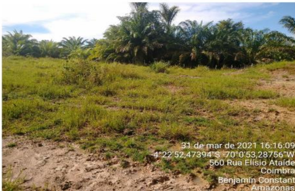
Foto 03: local da área da JAZIDA 1, com a localização e os pares de coordenadas geográficas no Município de Benjamin Constant/AM.