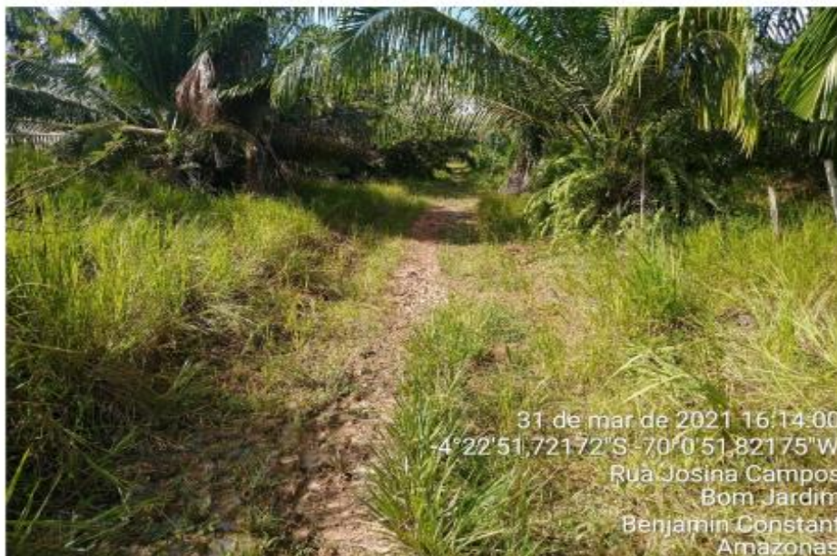
Foto 01: Acesso a área da JAZIDA 1, com a localização e os pares de coordenadas geográficas no Município de Benjamin Constant/AM.

Por mais que tenha sido identificado três áreas para jazida, apenas uma foi possível ir “in loco” para reconhecimento do local, somente a JAZIDA 1 foi visitada, conforme fotos 01 a 04. As demais JAZIDA 2 e JAZIDA 3 não foi possível ir ao local, pois os acessos as mesmas estavam intrafegáveis com os veículos que dispomos no momento, impedindo desta forma o deslocamento da equipe de campo ao local, mas foram coletados os pares de coordenadas, por meio da ferramenta do Google Earth, conforme fotos 05 e 06.