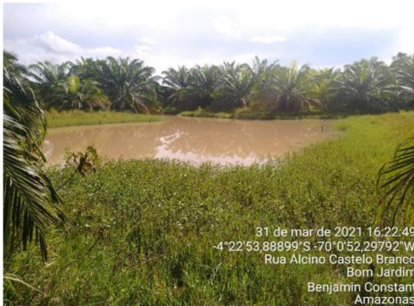
Foto 04: Identificação de curso hídrico nas proximidades da área da JAZIDA 1, com a localização e os pares de coordenadas geográficas no Município de Benjamin Constant/AM.