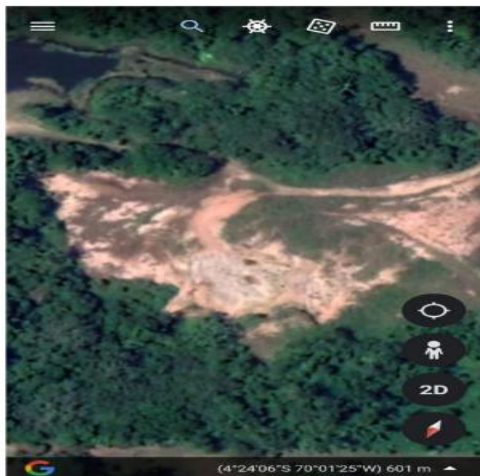
Foto 05: local da área da JAZIDA 2, com a localização e os pares de coordenadas geográficas no Município de Benjamin Constant/AM.