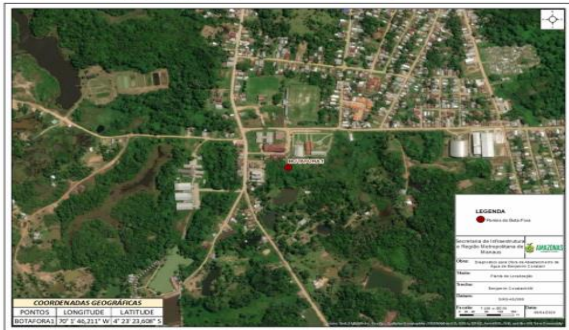
Figura 11: Mapa de identificação do Bota-Fora para possível utilização na Obra de Abastecimento de água do Município de Benjamin Constant/AM.