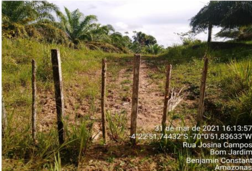
Foto 02: Entrada da área da JAZIDA 1, com a localização e os pares de coordenadas geográficas no Município de Benjamin Constant/AM.